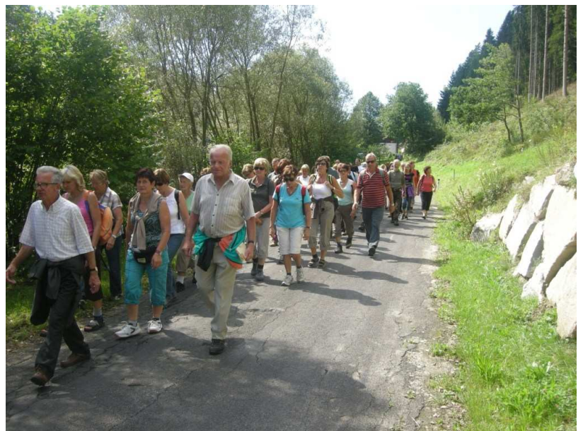
Bericht u. Foto von Anton Bumberger

Auch heuer pflegten wieder 90 Pilger (aus 11 Pfarren) im Alter von 11 bis 95 Jahren diese Jahrhunderte alte Tradition und freuten sich dankbar über das wohl einzigartige Jubiläum ihres unermüdlichen Begleiters Pfarrer Joe.